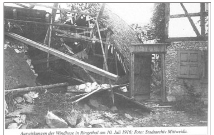
Auswirkungen der Windhose in Ringethal am 10. Juli 1916

Sie sehnten sich nach Frieden. In mehreren Städten kam es zu Friedensdemonstrationen. Und in Mittweida sollte schon seit 1902 ein Marktbrunnen errichtet werden. Johannes Schilling lieferte dazu Modelle. 1916 wurde die Finanzierung gesichert. Und der Brunnen wurde dann zum „Friedensbrunnen“.