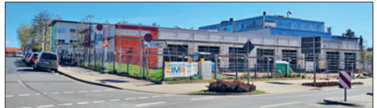
Die neue Rettungswache steht kurz vor der Fertigstellung.